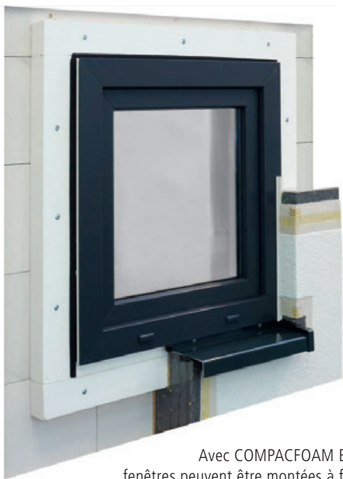
Avec COMPACFOAM ECO les fenêtres peuvent être montées à fleur de l'isolant au lieu de la pose habituelle dans l'ébrasement.